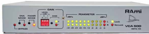
Contrôleur de gain numérique Digital gain controller

Le VCA500 permet d'agir sur le niveau audio d'un signal audionumérique. Il est composé de deux sections distinctes :