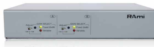
Contrôleur de gain analogique Analog gain controller

Le VCA200, inséré dans une chaîne d'amplification permet de régler le niveau sonore à distance. Il comprend deux canaux distincts pouvant être utilisés, soit en stéréo, soit en deux fois mono.