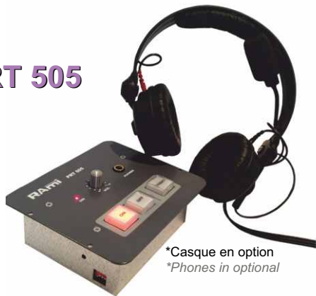
*Casque en option *Phones in optional

Le PRT505 regroupe dans le même boîtier :